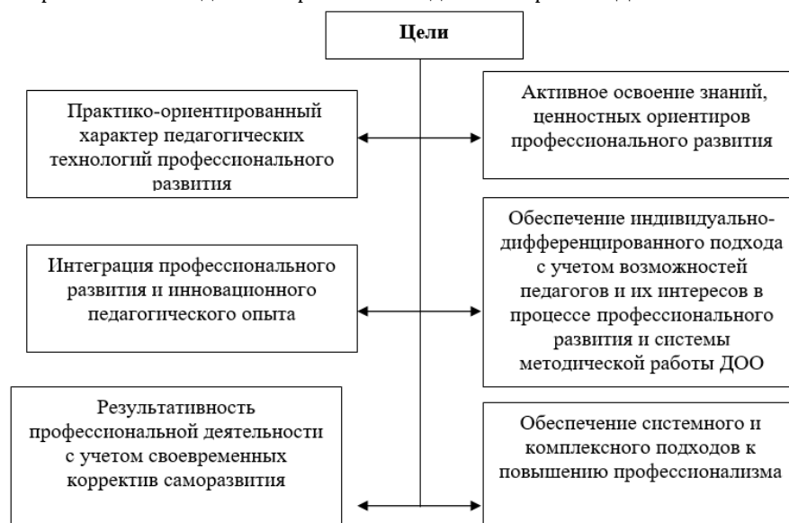
Рисунок 1. Цели использования педагогических технологий, оптимизирующих профессиональное развитие педагогов ДОО.

Мы полагаем, что в совершенствовании профессионального мастерства и развитии себя как профессионала первостепенное значение приобретают активные педагогические технологии в структуре методической работы ДОО.