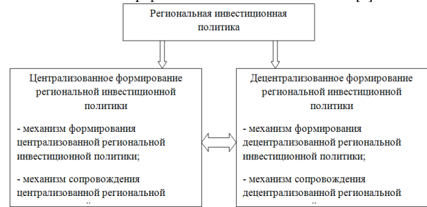
Рисунок 1. Методы формирования региональной инвестиционной политики

Содержание понятия механизма реализации инвестиционной политики в регионе можно охарактеризовать как процесс концентрации и мобилизации инвестиционных ресурсов, организации контроля за их эффективным использованием, выработки регулирующих воздействий, направленных на усиление положительных тенденций в инвестиционной сфере и ослабление негативных [2].