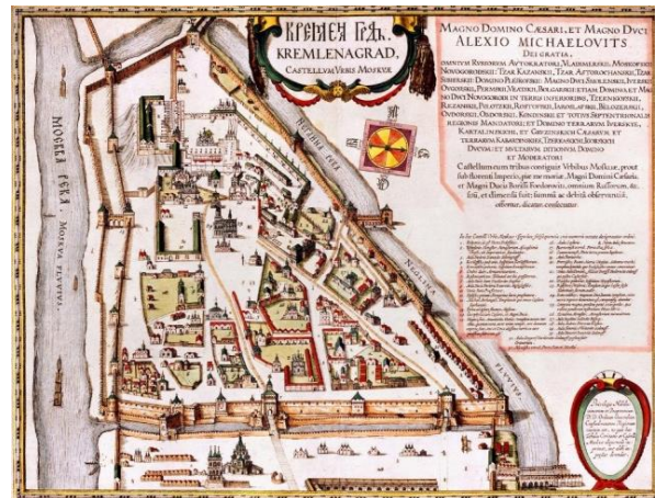
Рис. 6. Общий вид Москвы.