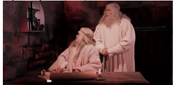
Рис. 7. Пиши: ОТНЮДЬ; местами – ШИБКО («Рюрики»)