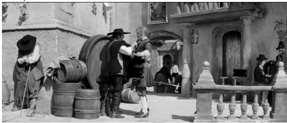
Рис. 1. – Смотри, ни глотка вина. Плащ на плечо! («Рукопись, найденная в Сарагосе»)

Комментарий. Метать, бросать и вдобавок еще англосаксонская мачта . Не густо. «Переброшенное через что-то», скажем, через плечо может быть также и плащ , Рис. 1.