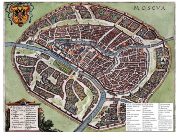
Рис. 5. План общего вида Москвы.

Посмотрим теперь изображения начальной карты Москвы. Рис. 5 – 7.