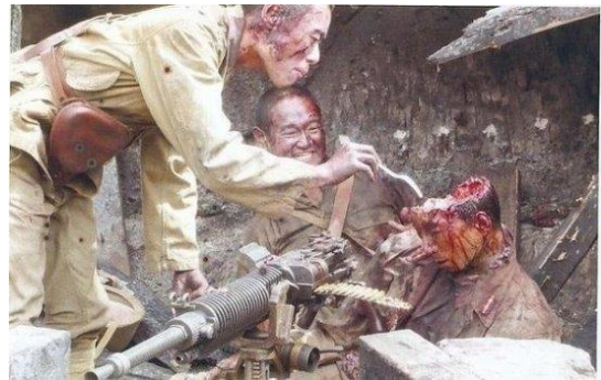
Рис. 3. Японские самураи за дегустацией свежего МОЗГА

МОЗГ это МАЙАН или, возможно, МАЖЖАН, а также МУЗГЕНО или МАЗГА. Последнее ближе всего, хотя это лишь частный случай КОСТНОГО МОЗГА. Обозначение именно МОЗГа в таком понимании отсутствует (он, вероятно, называется как-то ИНАЧЕ), хотя внутрикостные жировые отложения тоже считаются МОЗГОМ, по-видимому, по сходству вкуса Рис. 3.