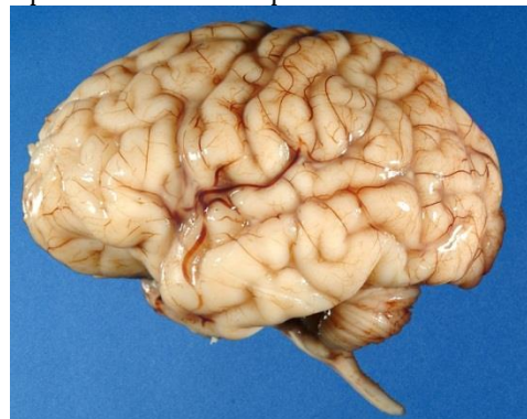
Рис. 2. Внешний вид МОЗГА

Откуда же возникает такая характеристика рассматриваемого объекта? – Естественно, из его внешнего вида, представленного многочисленными ИСКРИВЛЕНИЯМИ или ИЗГИБАМИ, резко отличающимися от прочих частей тела рис. 2.