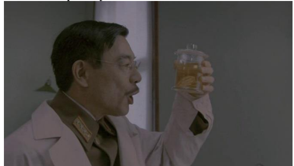
Рис. 4. Какая красота!.. (фильм «Солнце»)

При этом японский император, по мнению российского либерала, ученый интеллигент Рис. 4.