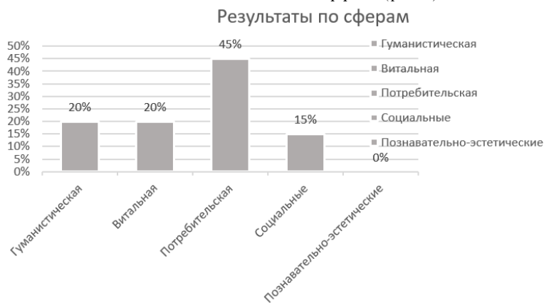
Рисунок 1. Диаграмма ценностной соотнесенности желаний «на входе».

После обсуждения фильма, была проведена контрольная диагностика с задачей выявить развивающий эффект (рис.2).