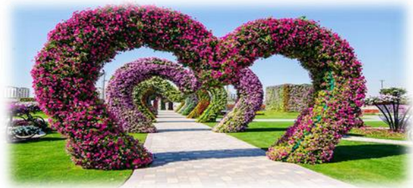
Рис.2. Современный ландшафтный дизайн — вертикальные клумбы в виде фигур: петуния разных видов и сортов

В современном озеленении стали использовать вертикальные клумбы, или «трехмерные» выполняются в виде стены или какой-то фигуры, это выставочный или же эксклюзивный вариант, в последнее время стали очень популярными в озеленении и требуют определенных навыков и знаний получаемых на практических занятиях ландшафтного дизайна (рис.2).