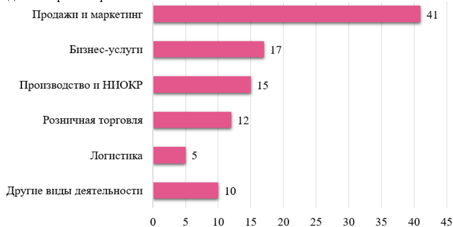
Рисунок 2 – Структура ПИИ в Германии по видам деятельности 2020 г., %.

В структуре накопленных ПИИ в экономику Германии 5,4% приходится транспортную логистику.