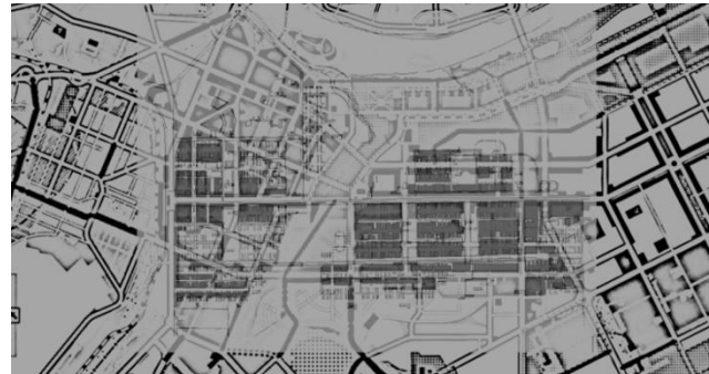
Рис.3. Наложение эскиза плана социалистического города Щеглова арх. Э.Мая (1931) на фрагмент генерального плана г. Кемерово. Авторская реконструкция О.В. Митяниной, 2015 г.

Таким образом, часть плана «Соцгорода» Эрнста Мая была реализована, что наглядно видно из представленного в статье совмещения плана 1931 г. со сложившейся планировочной структурой города Кемерово (рис.3).