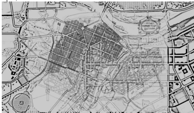
Рис.1. Наложение эскиза плана города-сада Щегловска арх. П.А. Парамонова (1918) на современный генеральный план г. Кемерово. Авторская реконструкция О.В. Митяниной, 2015 г.

Таким образом, задуманный П.А. Парамоновым «город-сад» не соответствовал требованиям, которые предъявлялись к устройству будущего индустриального центра. Жители города в большей части были одиночками, молодыми и идейными рабочими, для которых обустройство личных усадеб было обременением. В связи с этим город состоял из грязных неблагоустроенных и не озелененных улиц, где не было водопровода, канализации и централизованного отопления. К инженерной инфраструктуре города были подключены лишь наиболее крупные дома в Притомском районе, такие как больница, банк, исполком, почта и телеграф и лишь несколько жилых домов, где проживали советские чиновники, врачи, учителя, артисты.